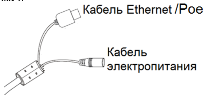
Рисунок 1 – Подключение IP-видеокамеры

9.6. Подключение IP-видеокамеры приведено на рисунке 1.