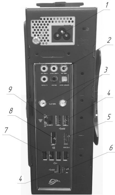
Рисунок 1 – Подключение системного блока (расположение и внешний вид разъемов может отличаться от приведенного)